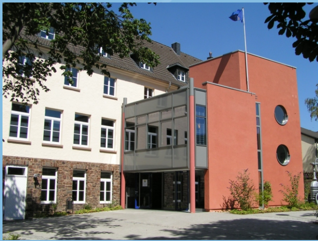
Wasser-Info-Zentrum Eifel (W.I.Z.E.)